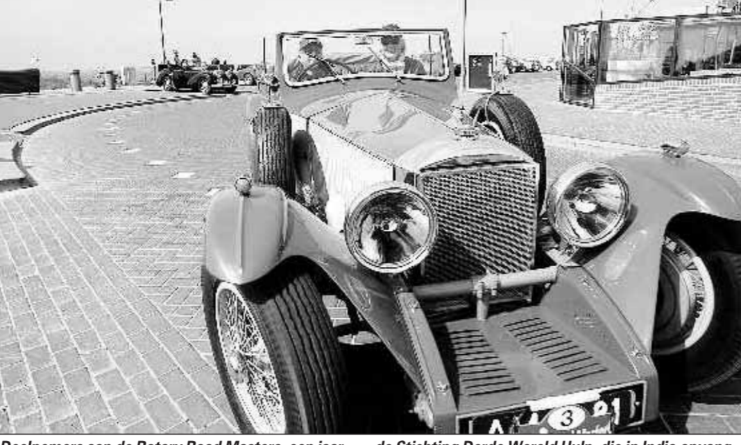
Deelnemers aan de Rotary Road Masters, een jaarlijkse autorit met oldtimers, houden een tussenstop in Egmond aan Zee. Voor de dertiende keer hield de Rotary Heemstede Bennebroek gisteren een rally voor het goede doel. Ditmaal ging de opbrengst naar de Stichting Derde Wereld Hulp, die in India opvangtehuizen voor gehandicapte kinderen bouwde en zorgt voor scholing. Gulle gevers konden voor de rit een passagiersstoel kopen in een oldtimer. Voor jaar bracht de rally 20.000 euro op.