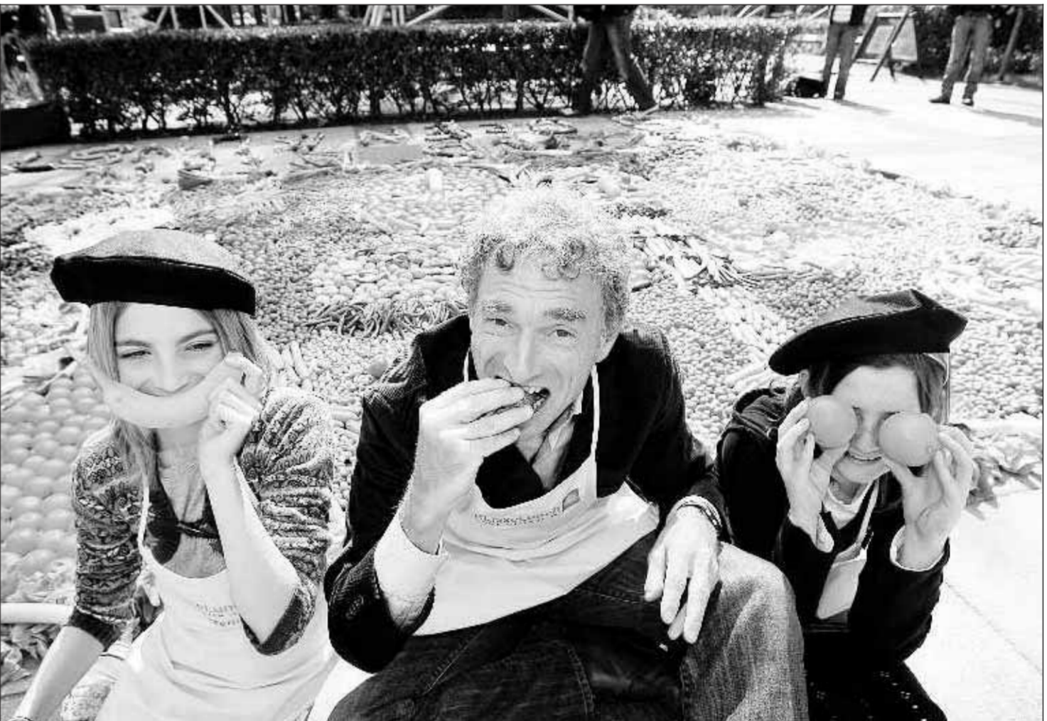
Maar liefst vijftientig vierkante meter aan bloemkool, radijs, bananen, paprika en andere groenten en fruit staan symbool voor het motto 'Gezond eten is geen kunst'. Het gezonde kunstwerk werd gisteren in Dierenpark Amersfoort overgedragen aan oud-

„We hebben weliswaar een achterstand op gebied van cultuurvoorzieningen, maar zijn die als een gek aan het inhalen. Zo hebben we sinds kort een prachtig theater, waar meer dan duizend mensen in kunnen. En in maart is er een popmuziekzaal opengegaan. Al me al hebben we er voor bijna