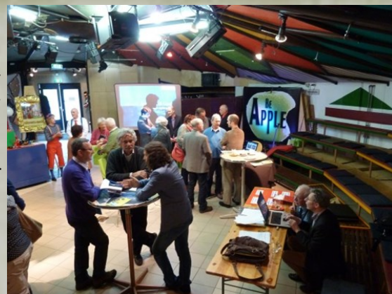
Foto: Impressie markt 2012 in Velp

Geef dat dan vóór 27 oktober door aan ons secretariaat vno@openluchttheaters.nl